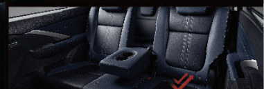
GHÉ DA CAO CẤP GIẢM HẤP THỤ NHIỆT