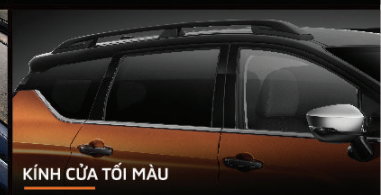
KÍNH CỬA TỐI MÀU