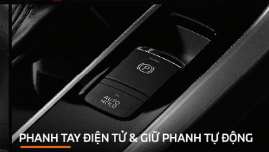
PHANH TAY ĐIỆN TỬ & GIỮ PHANH TỰ ĐỘNG