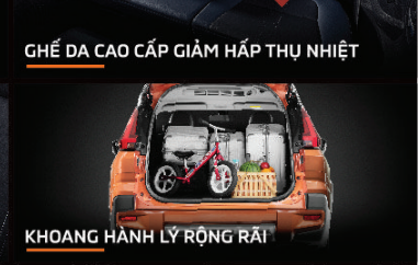
KHOANG HÀNH LÝ RỘNG RÃI