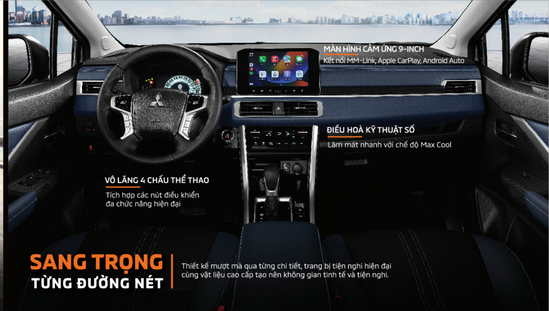
MÀN HÌNH CẢM ỨNG 9-INCH Kết nối MM-Link, Apple CarPlay, Android Auto

Khung xe RISE toàn cầu của Mitsubishi được thiết kế để hấp thụ va chạm & phân tán lực, đảm bảo sự an toàn của cả gia đình xuyên suốt hành trình.