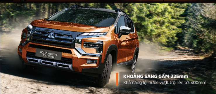
KHOẢNG SÁNG GẮM 225mm Khả năng lội nước vượt trội lên tới 400mm