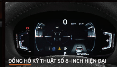
ĐỒNG HỒ KỸ THUẬT SỐ 8-INCH HIỆN ĐẠI