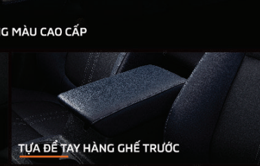
TỤA ĐỂ TAY HÀNG GHÉ TRƯỚC