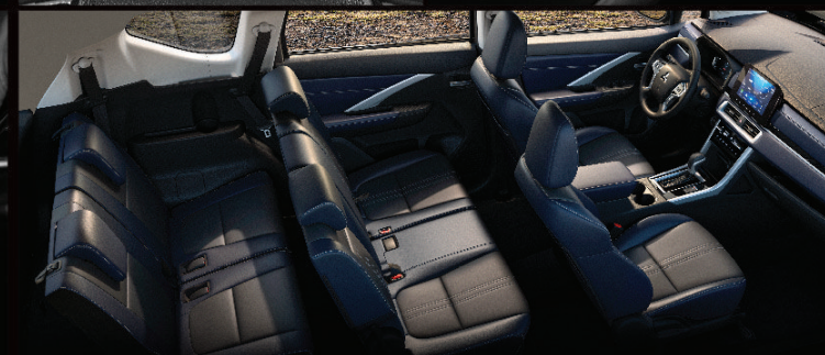
NỘI THẤT 7 CHỖ RỘNG RÃI VỚI CHÉ DA 2 TÔNG MÀU CAO CẤP