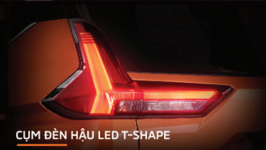
CỤM ĐÈN HẬU LED T-SHAPE