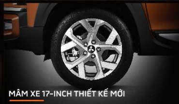
MẪM XE 17-INCH THIẾT KẾ MỚI