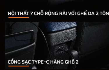
CỔNG SẠC TYPE-C HÀNG GHÉ 2