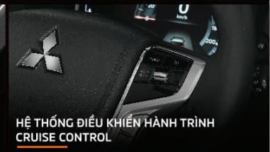
HỆ THỐNG ĐIỀU KHIỂN HÀNH TRÌNH CRUISE CONTROL