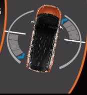
Không có ASC

Hỗ trợ người lái giữ xe ổn định khi di chuyển trong điều kiện đường trơn trượt, góp phần giúp xe vào cua chính xác, mượt mà và an toàn.