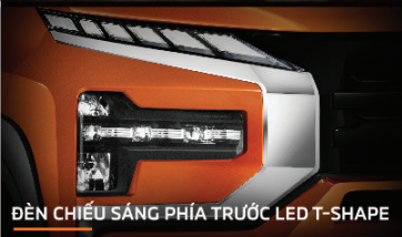
ĐÈN CHIẾU SÁNG PHÍA TRƯỚC LED T-SHAPE

Ngôn ngữ thiết kế Dynamic Shield kết hợp với lưới tản nhiệt, ốp cản thể thao cùng thanh giá nóc màu đen mang đến sự hiện đại, cá tính đồng thời giúp nổi bật phong cách SUV.