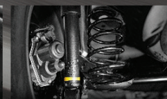
VẬN HÀNH AN TOÀN