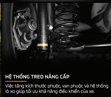
HỆ THỐNG TREO NÂNG CẤP Việc tăng kích thước phuộc, van phuộc và hệ thống lò xo giúp tối ưu khả năng điều khiển của xe.